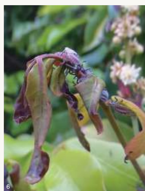
圖4~5. 龍眼大約在二月底至五月抽紅嫩枝葉並開花結幼果，常吸引荔枝椿象前來交配或吸汁，荔枝椿象粗短口針多直接插入花芽、葉芽、嫩枝、花柄或果柄，而非刺進花果或樹幹。