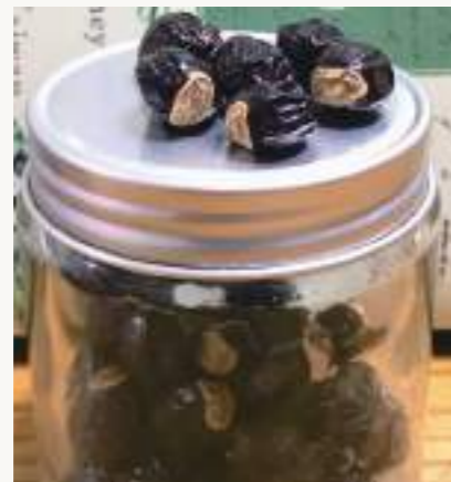
圖3. 龍眼果實似龍目，古詩云「圓如驪珠，赤若金丸，肉似玻璃，核如黑漆」。

荔枝椿象( Tessaratoma papillosa )屬半翅目(Hemiptera)、荔椿科(Tessaratomidae)，為荔枝及龍眼常見的害蟲，分布於泰國、越南、寮國、香港及中國等地，遲至1997年首次在金門發現，2009年則首次在臺灣高雄發現，目前除澎湖縣尚未發現、臺東縣、花蓮縣零星分布外，已經在臺灣各縣市普遍發生，其寄主植物主要為無患子科(Sapindaceae)植物包含荔枝( Litchi chinensis )、龍眼( Dimocarpus longan )、無患子( Sapindus mukorossi )及臺灣欒樹( Koelreuteria henryi )等四種喬木。