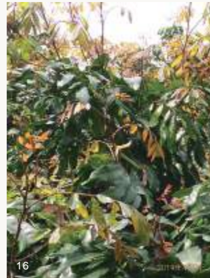
圖16~17. 龍眼葉芽如正常生長，應該會長出許多紅嫩枝葉（上圖）並正常展開逐漸變青綠。但如果發生鬼帚病（下圖），則葉芽無法展開，且組織增生毛呈現簇生狀乾枯情形，開花率亦會降低。

高雄大崗山一帶地區龍眼鬼帚病相當普遍，惟截至目前為止仍無法證實此病徵為荔枝椿象媒介不明病原造成；然而卻有愈來愈多證據顯示可能是因為節蟬數量暴增取食汁液，而使龍眼葉芽組織變形增生枯萎，導致樹葉無法展開且開花率降低。